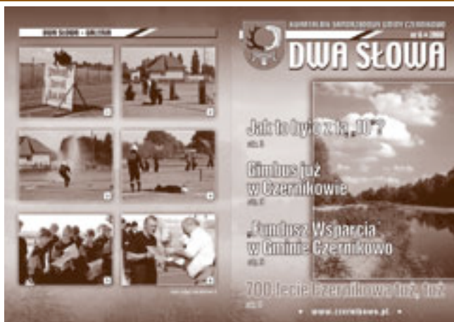
Okładka: str. 16 - 1-6 Zawody strażackie