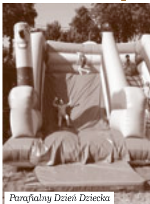
Parafialny Dzień Dziecka

8 czerwca odbył się trzeci parafialny dzień dziecka. Rozpoczęła go Msza Święta o godz. 12.00. Po niej odbył się koncert Tomka Kamińskiego – kompozytora muzyki chrześcijańskiej. Dalsza część to zabawa plenerowa z różnymi atrakcjami, przygotowanymi dla dzieci. Bogu dziękujemy