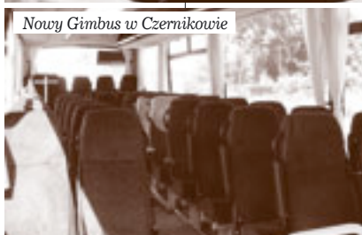
Nowy Gimbus w Czernikowie

zu osób do 160 cm wzrostu i 50 kg wagi. Oznacza to, że większość gimnazjalistów, a także osoby dorosłe nie będą mogły podróżować nim w komfortowych warunkach. Jest to o tyle istotne, że nie będzie on wykorzystywany do dalszych wjazdów młodzieży z naszych szkół oraz ich opiekunów. Stare polskie przysłowie mówi jednak, że „daranemu koniowi w zęby się nie zagląda”. Trzeba zatem się cieszyć z prezentu i eksploatować go w taki sposób, aby w pełni wykorzystać jego możliwości. W związku z parametrami tego autobusu podjęto decyzję, że od nowego roku szkolnego będzie on woził dzieci do Szkoły