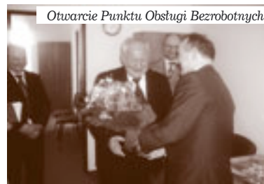
Otwarcie Punktu Obsługi Bezrobotnych