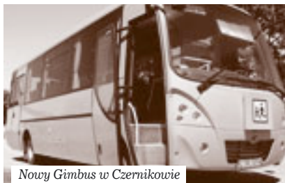
Nowy Gimbus w Czernikowie

Mieszkańcy naszej gminy zauważyli zapewne, że od niedawna po naszych drogach jeździ nowy autobus przeznaczony do przewozu dzieci. Jest to pojazd otrzymany przez naszą gminę z Ministerstwa Edukacji Narodowej. Jego wartość zgodnie z umową to blisko 340.000 zł. Przystosowany jest on do przewozu 40 uczniów. Wyprodukowany został przez firmę KAPENA ze Słupska na licencji IVECO. Niestety w zamówieniu przygotowanym przez ministerstwo postawiono następujące wymagania techniczne: 90% miejsc pasażerskich ma być przystosowanych do przewo-