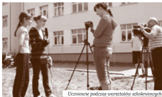
Uczniowie podczas warsztatów szkoleniowych