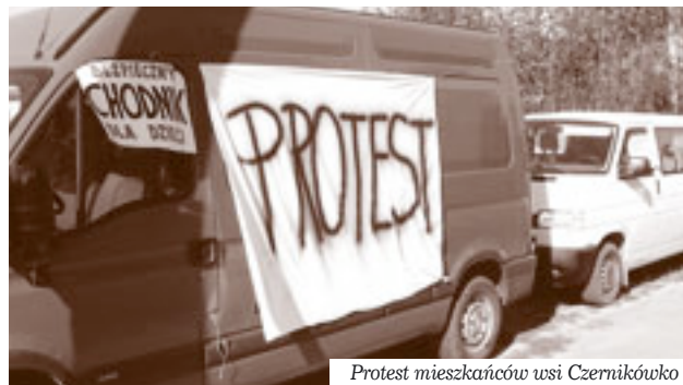
Protest mieszkańców wsi Czernikówko

– poszerzenia wjazdów indywidualnych do posesji do szeroko-