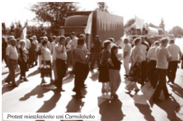
Protest mieszkańców wsi Czernikówko

Największą inwestycją realizowaną obecnie na terenie naszej gminy jest przebudowa drogi krajowej nr „10”. Prowadzone prace wzbudzają wśród mieszkańców wiele emocji. Większość z nich jest zadowolona, są jednak osoby, które podchodzą do nich z dezaprobatą. Chodzi tu o mieszkańców, których interesy nie zostały uwzględnione w projekcie wspomnianej inwestycji. Dodatkowo pojawiają się nieprawdziwe informacje, że władze Gminy Czernikowo nie podjęły wystarczających działań, aby w trakcie realizacji tego zadania uwzględnione zostały potrzeby wszystkich mieszkańców naszej lokalnej społeczności. Takie stwierdzenia są w mojej ocenie niesprawiedliwe, co