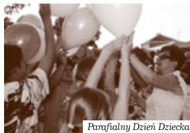
Parafialny Dzień Dziecka

8 czerwca odbył się trzeci parafialny dzień dziecka. Rozpoczęła go Msza Święta o godz. 12.00. Po niej odbył się koncert Tomka Kamińskiego – kompozytora muzyki chrześcijańskiej. Dalsza część to zabawa plenerowa z różnymi atrakcjami, przygotowanymi dla dzieci. Bogu dziękujemy