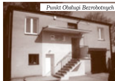
Punkt Obsługi Bezrobotnych