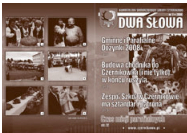
Okładka: str. 16 - 1-6 Dożynki 2008