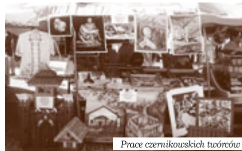
Prace czernikowskich twórców