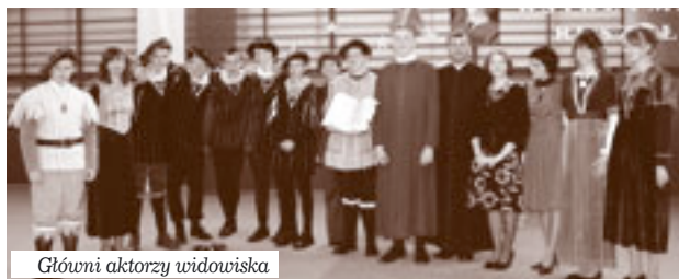
Główni aktorzy widowiska

Wszyscy zaproszeni goście złożyli na ręce dyrektora szko-