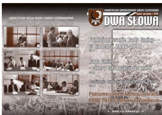
Okładka: 1/6 Uroczysta Sesja Rady Gminy.